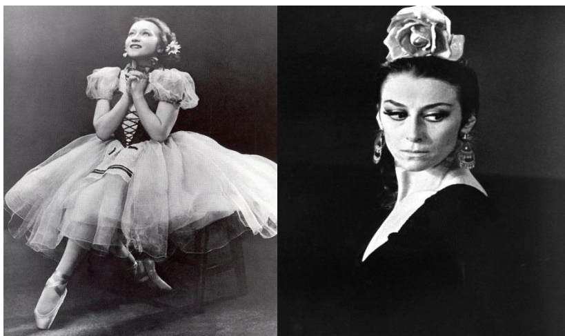
а) Галина Уланова